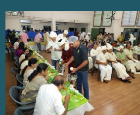
Ann's One day tour to Cherai