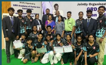
Rotary Karate team- 20 th National Moses memorial karate championship at Coimbatore